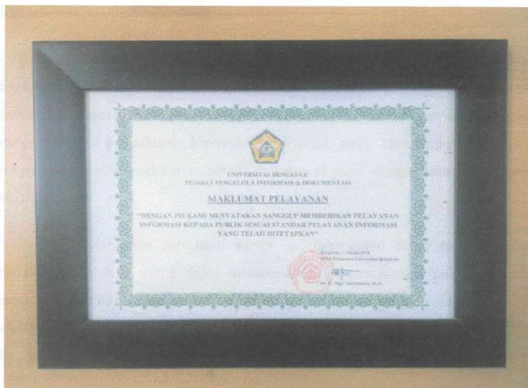
Gambar 1. Maklumat Pelayanan PPID Pelaksana Universitas Bengkulu

Selama Tahun 2018 semua permintaan informasi melalui PPID Pelaksana UNIB pada Tahun 2018 berhasil dilayani dengan baik oleh PPID Pelaksana UNIB. Pelayanan ini sejalan dengan maklumat pelayanan PPID UNIB, yaitu dapat memberikan pelayanan informasi sesuai dengan standar yang telah ditetapkan sesuai dengan peraturan perundang-undangan, sebagaimana terdapat didalam gambar 1 dibawah ini.