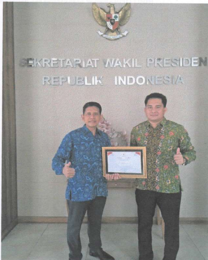
Gambar 5. Penyerahan Penganugerahan KIP RI 2019