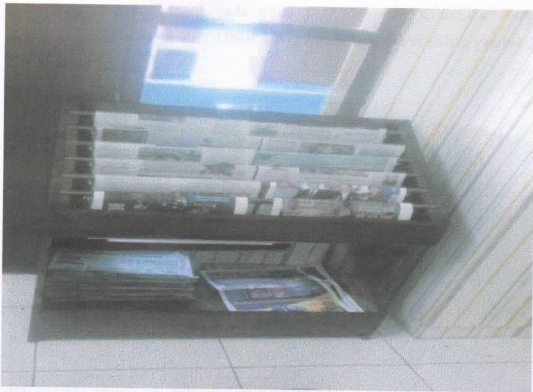
Gambar 2. Rak tempat koran dll.

Pembuatan Rak / media, tempat koran, Bulletin, Leaflet dll. Dilaksanakan dalam rangka untuk mempermudah mencari informasi yang ada, sehingga baik koran / bulletin / Leaflet tersebut tertata dengan baik dan dapat di ambil sewaktu-waktu dari Rak yang sudah di buat agar tersusun dengan rapi. Selain itu pembuatan rak untuk mengefisienkan ruangan yang ada, sebagaimana terdapat didalam gambar 2 dibawah ini.