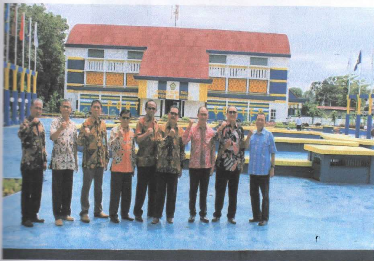
Gambar 3. Peresmian Gedung Baru UNIB