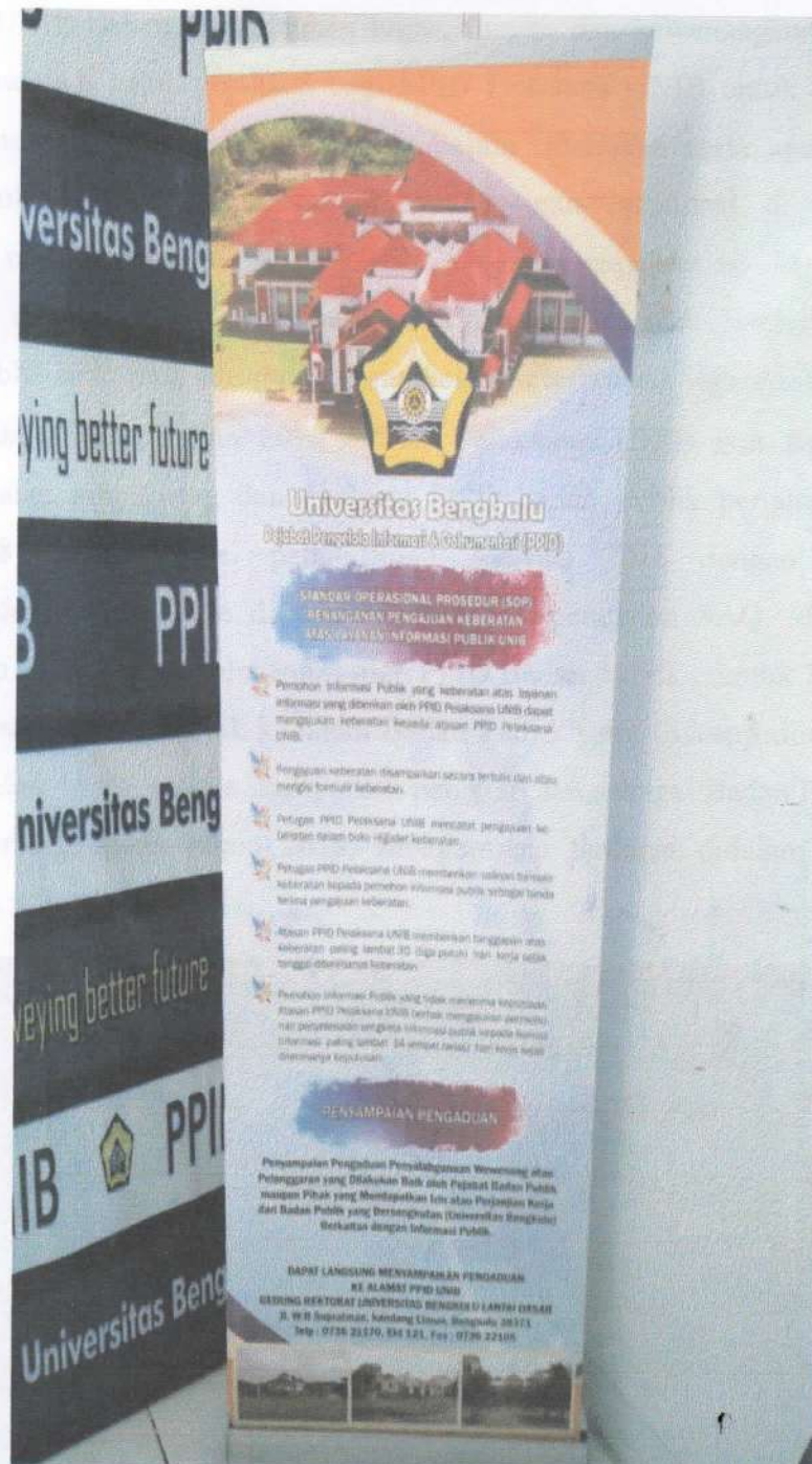
Gambar 4 . SOP keberatan terhadap pemberian pelayanan informasi di PPID UNIB

Pembuatan Banner PPID UNIB pada tahun 2018 ada 1 Banner yaitu Banner tentang SOP tentang keberatan terhadap pemberian Pelayanan Informasi oleh PPID UNIB. Sebagaimana terdapat didalam Gambar 4 dibawah ini.